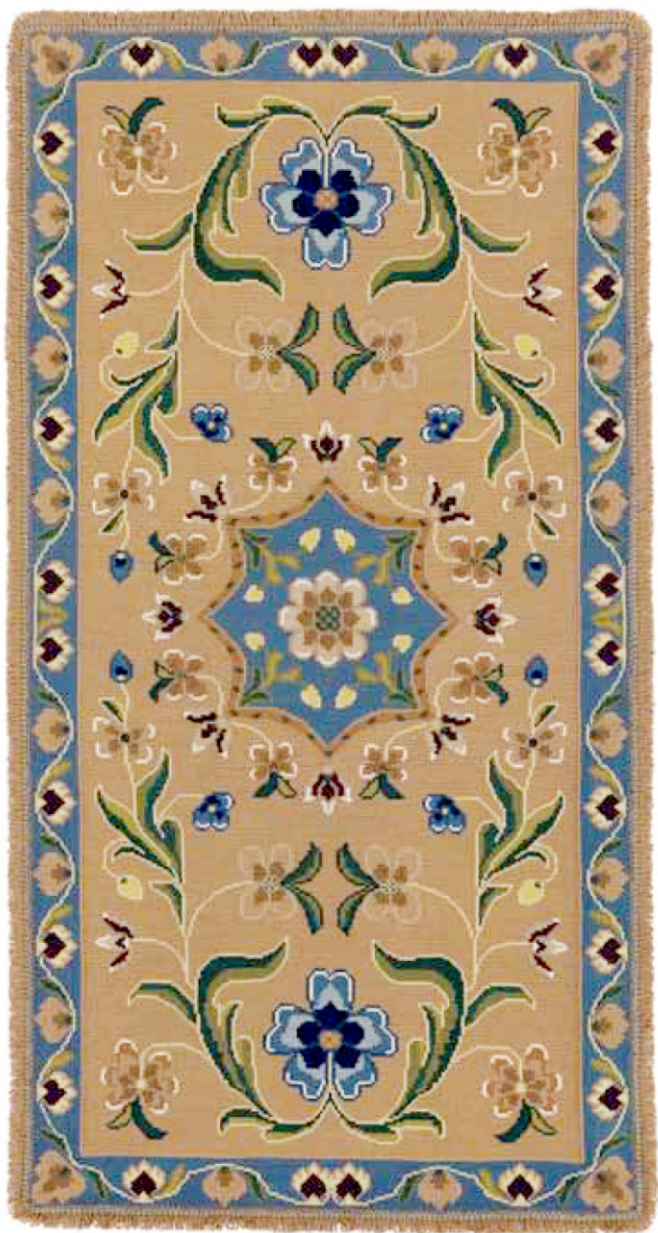
Tapete de Arraiolos Cópia do Séc. XIX Fundação Ricardo Espírito Santo Silva C.M.A

Com a produção de Arraiolos no período áureo da sua indústria — a partir do segundo quartel do séc. XVIII — assistimos a um afastamento gradual da influência oriental, embora se mantendo, não constitui, como até então, a principal fonte de inspiração dos motivos decorativos.