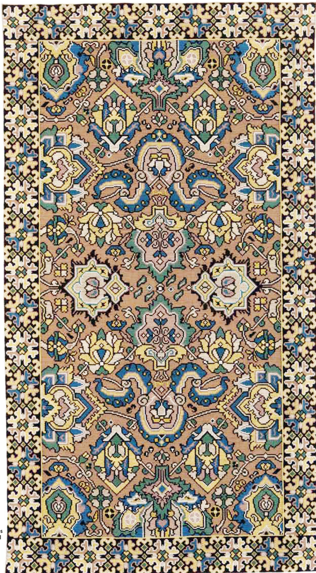
Tapete de Arraiolos Cópia do Séc. XVIII Fundação Ricardo Espírito Santo Silva C.M.A