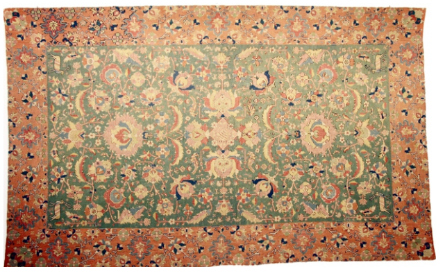
Coleção: MNAA (Museu Nacional de Arte Antiga) Datação: Séc. XVII Dimensões: 340 cm x 213 cm

Teresa Pacheco Pereira Museu Nacional de Arte Antiga