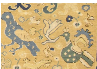
Coleção: MNAA (Museu Nacional de Arte Antiga) Datação: Séc. XVIII Dimensões: 279 cm x 226 cm