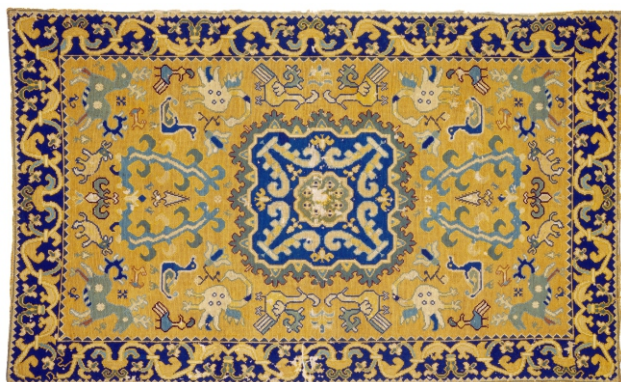
Coleção: MNAA (Museu Nacional de Arte Antiga) Datação: Séc. XVIII Dimensões: 169 cm x 112 cm