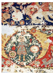
Coleção: MNAA (Museu Nacional de Arte Antiga) Datação: Séc. XVII Dimensões: 340 cm x 213 cm