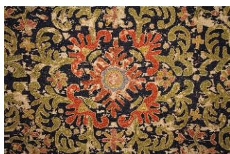
Coleção: MNAA (Museu Nacional de Arte Antiga) Datação: Séc. XVII Dimensões: 294 cm x 168 cm