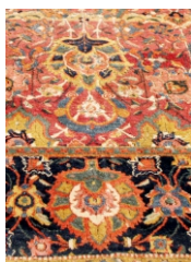
Coleção: MNAA (Museu Nacional de Arte Antiga) Datação: Séc. XVII Dimensões: 203 cm x 146 cm